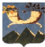
Comune di Grassano